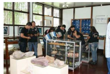
Visitações ao Museu de Geociências por alunos de Ensino Médio de escolas públicas e particulares da cidade de Belém.