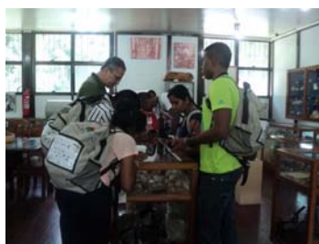
13º Simpósio de Geologia da Amazônia - Visitações ao estande do PPGG e Museu de Geociências